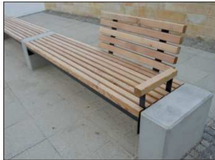
Bänke mit Rücken- und Armlehne