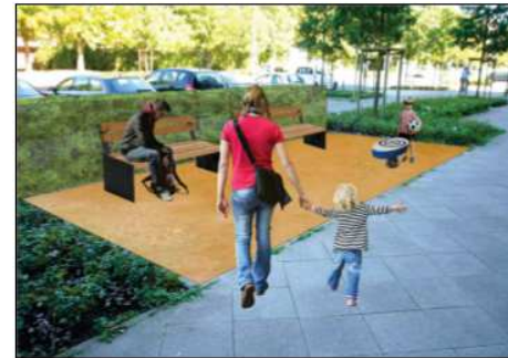
Hecke zum Radweg . Bänke . Spielpunkt