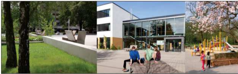
Präsentation Bürgerworkshop - 9. März 2017