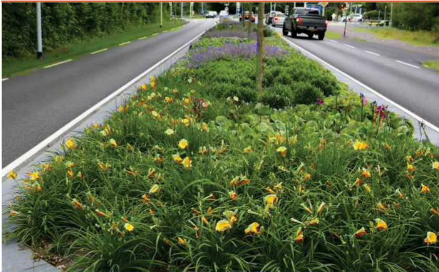
Griffioen Wassenaar BV