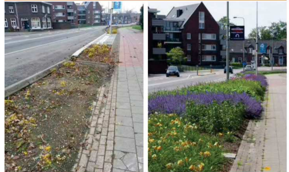
Griffioen Wassenaar BV